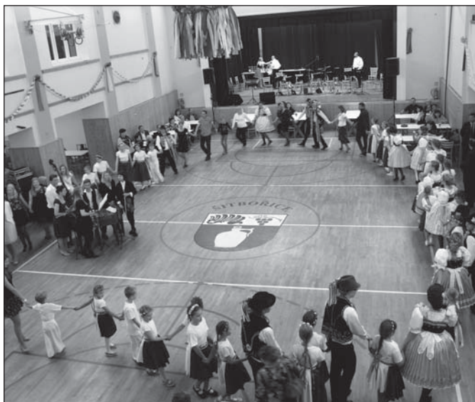
Martinské hody 2017