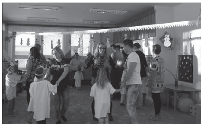
Mikulášské hraní s rodiči