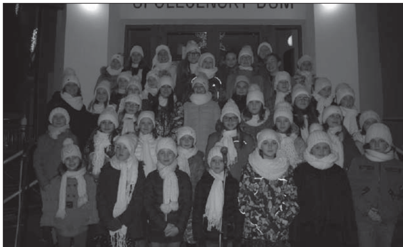
Rozsvěcování vánočního stromu