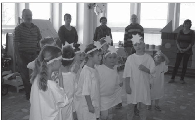
Mikulášské hraní s prarodiči