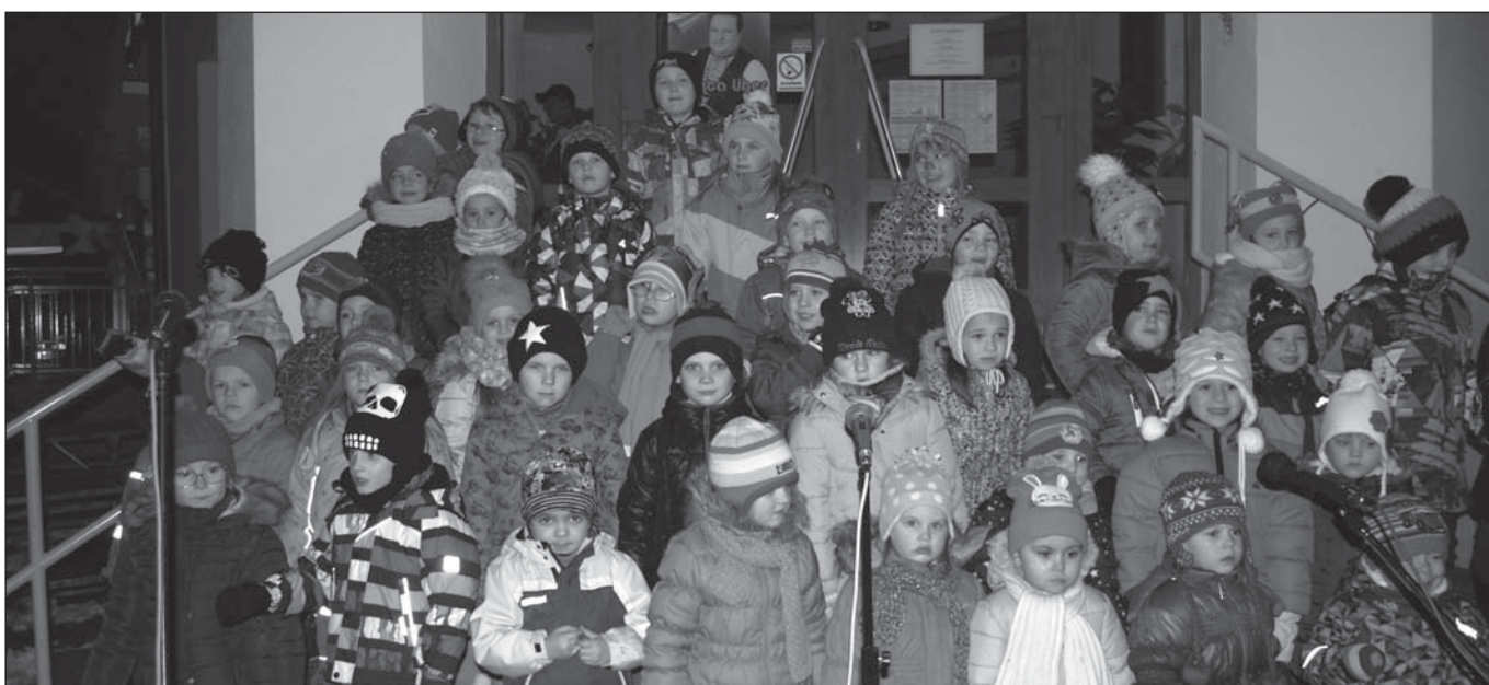
Rozsvěcování vánočního stromu