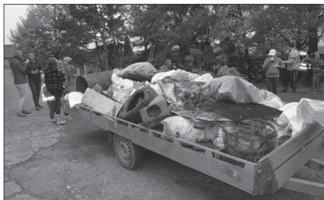
Druhá méně plná vlečka sesbíraných odpadků