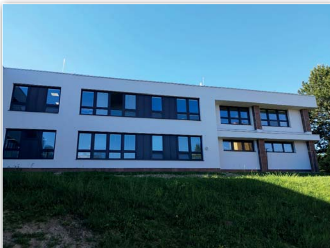
Dokončená zateplená část budovy ZŠ