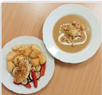
Tilápie v bylinkové krustě s grilovanou zeleninou