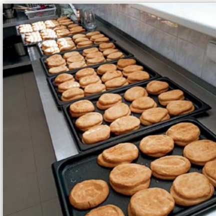
Beleše po upečení