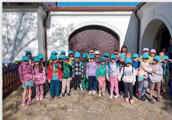
Modrá třída - Kovárna Těšany