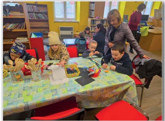
FOTO Z VELIKONOČNÍ POMLÁZKY ŽÁČKŮ DRUHÉHO ROČNÍKŮ