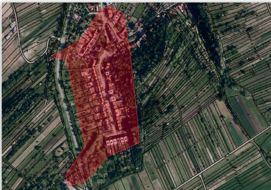
Rozsah plánované kabelizace vedení nízkého napětí v ul. Domaninská

V rámci projektu přeshraniční spolupráce INTERREG byla za-