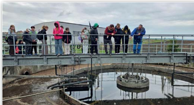
Exkurze vodárenské objekty