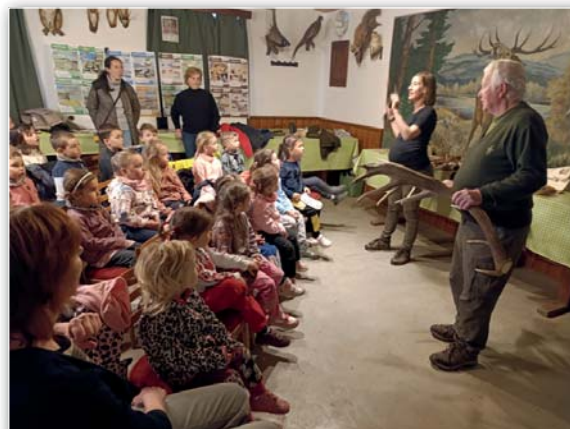
MŠ - Návštěva u myslivců