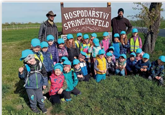
Modrá třída - Farnička Těšany