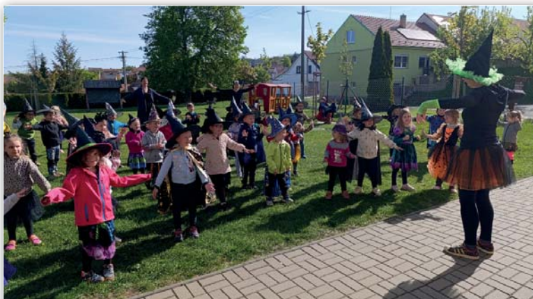
MŠ - Čarodějnické rejdní

V jarních měsících jsme si užili spoustu akcí. V dubnu proběhly ekologické vycházky „Jaro“, při kterých se děti seznamovaly s jarní přírodou. V rámci tématu Toulky Šitbořicemi jsme navštívili místní požární zbrojnici a myslivnu. Hasičům a myslivcům moc děkujeme! Tradiční „Čarodějnické rejdní“ jsme letos uspo-