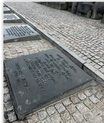
Exkurze do Osvětimi

Po celé prohlídce Osvětimi a Březinky jsme se ještě v Polsku stavili na jídlo a pak domů. Cestou jsme měli prostor přemýšlet o celém dni a zamys-