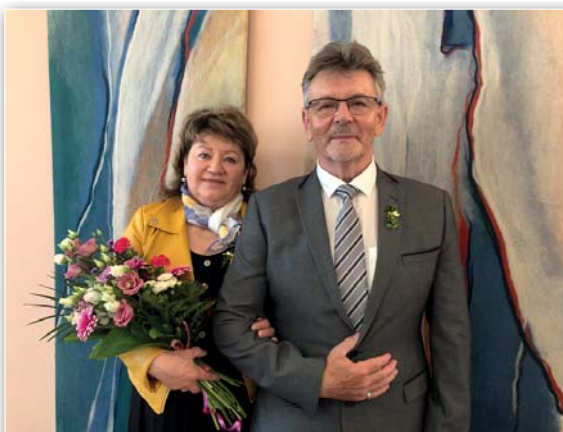
Zlatá svatba manželů Konečných

žitých ve zdraví a spokojenosti v kruhu jejich blízkých.