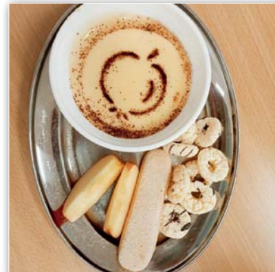
Vanilkový puding s piškotem a amarantovými kroužky