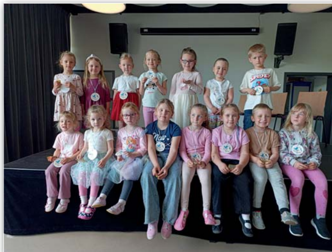
Šitbořický slaviček 2026