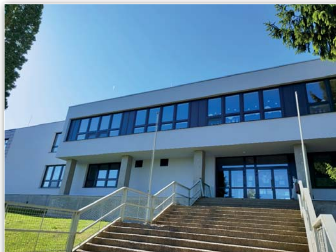
Zateplení vstupní části školy před dokončením