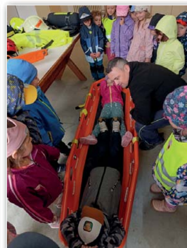
MŠ - Návštěva u hasičů