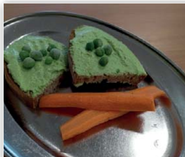
Pomazánka ze zeleného hrášku