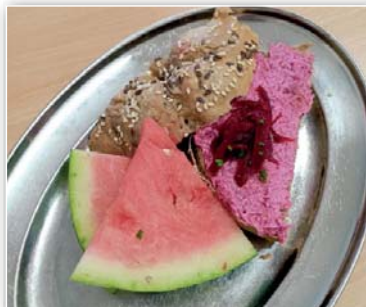
Pomazánka z červené řepy