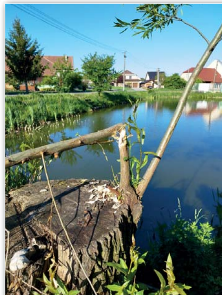
Stopy výskytu bobra na rybníčku