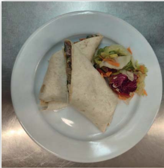
Tortilla s trhaným masem

nejmenší. A jaká jídla patří mezi nejoblíbenější? U slaných pokrmů děti nejvíce ocení smetanové omáčky, rajskou, rizoto, špagety nebo holandský řízek. Ze sladkých jídel vedou dukátové buchtičky a koláče s tvarohem.